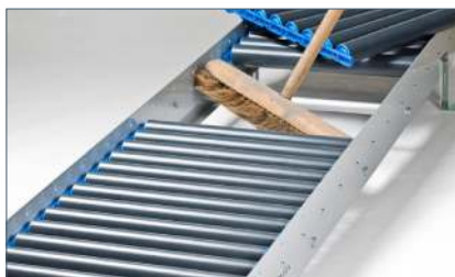
Eenvoudig schoon te maken