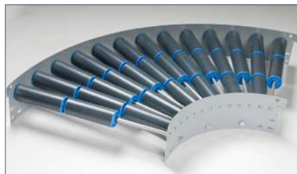
In diverse afmetingen en bochten verkrijgbaar