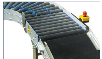
Ook opvoerbanden leverbaar

We behouden ons het recht voor om veranderingen door te voeren zonder voorafgaande kennisgeving. Hoewel er alles aan is gedaan om ervoor te zorgen dat alle informatie in dit document nauwkeurig is, aanvaardt TOMRA geen aansprakelijkheid voor eventuele onjuistheden.