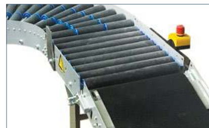
Bande élévatrice pour rallonger les chemins et pour une meilleure ergonomie

Nous nous réservons le droit d'effectuer des modifications sur les caractéristiques sans notification préalable. Bien que tous les efforts soient consentis pour délivrer dans ce document des informations précises, TOMRA ne saurait se porter responsable des erreurs, inexactitudes ou omissions qui pourraient se produire.