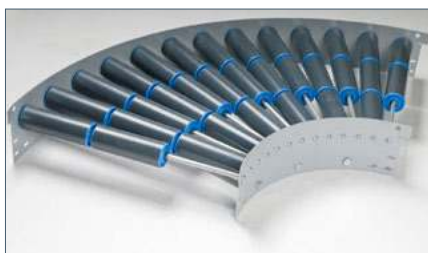
Plusieurs tailles et courbes disponibles